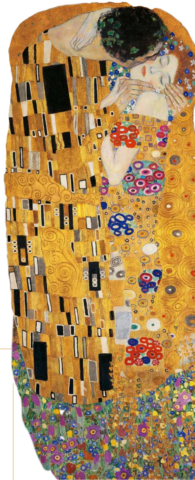
El beso Obra de Gustav Klimt

Accept what is, whether it is pleasant or not. Just observe, don't label, don't judge, don't fight. Let yourself go with what is happening. It won't be forever. Don't get lost in all that's going through your mind. You are not your thoughts, much less the interpretation you make of what you think.