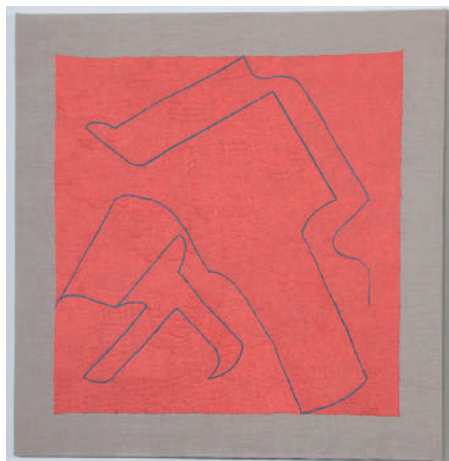
GUSTAVO PÉREZ MONZÓN Tres bordados | 2019

Happiness is synonymous of balance, of union because when we give, we are giving in unison. Congratulations! Let 2022 be a meeting of unity for all for the common benefit!